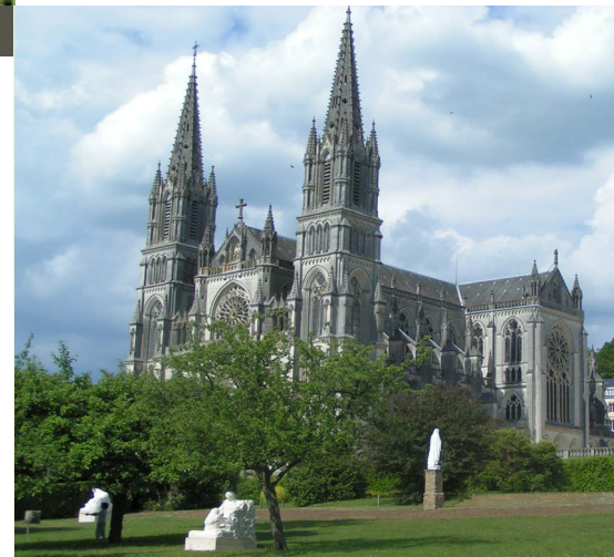
La Basilique Notre-Dame de Montligeon

Station Elan Tél. 02 33 25 18 67 ouvert tous les jours (6h30-21h30 la semaine, 8h-22h le week-end)